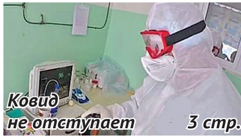
Ковид не отступает