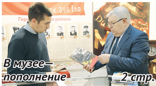
В музее — пополнение