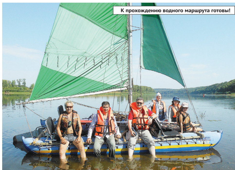
К прохождению водного маршрута готовы!