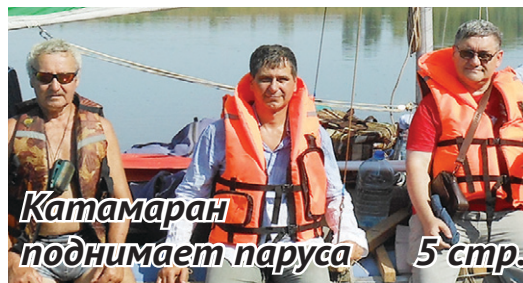
Катмаран поднимает паруса