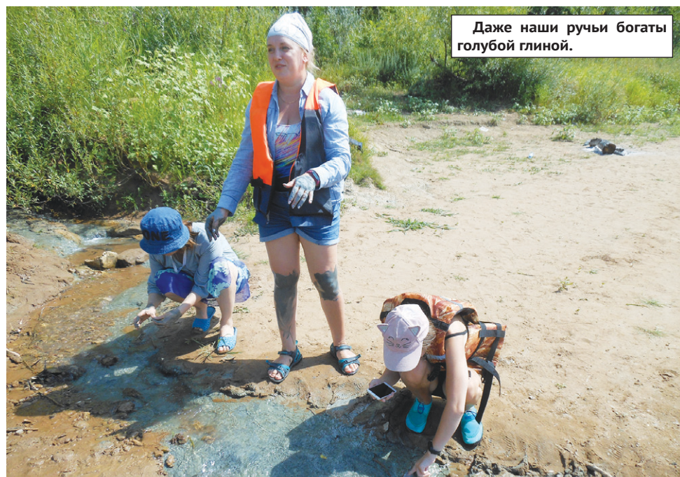
Даже наши ручьи богаты голубой глиной.

Слегка продрогшие, но довольные добрались до дома. Пройдена лишь треть маршрута, а это значит, что он должен быть преодолен до конца. Ведь впереди еще много новых открытий, находок, приключений и положительных эмоций, на которые так богата наша красавица Белая. Попутного ветра, «Бригантина»!