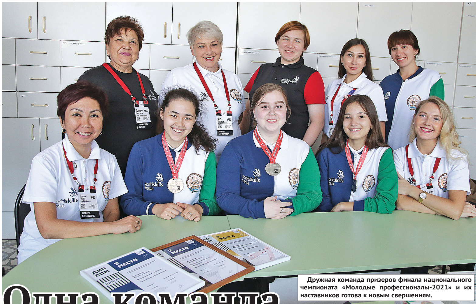
Дружная команда призеров финала национального чемпионата «Молодые профессионалы-2021» и их наставников готова к новым свершениям.